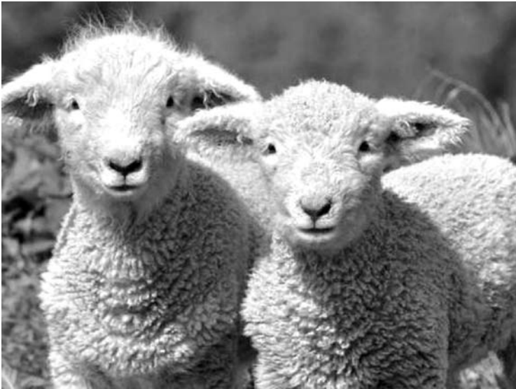
Avims grėsmę kelia ne tik laukiniai, bet ir naminiai plėšrūnai. Asociatyvi nuotr.

Kurklių seniūnijos Užulių kaimo (Kurklių seniūnija) ūkininko avis ketvirtadienį, lapkričio 6-ą dieną, užpuolė kaimyno šuo. Į aptvarą įsiveržęs plėšrūnas vieną avį sudraskė, kita rasta negyva tvenkinyje. Dar dvi avis šuo sužeidė.