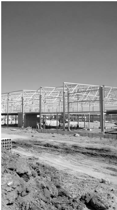
Žemės ūkio bendrovė „Delikatesas“ paukščių skerdyklai statyti sulaukė 4 mln. eurų paramos.

Skerdykloje planuojama pagaminti 30 tūkst. tonų paukštienos per metus. Didžiąją jos dalį