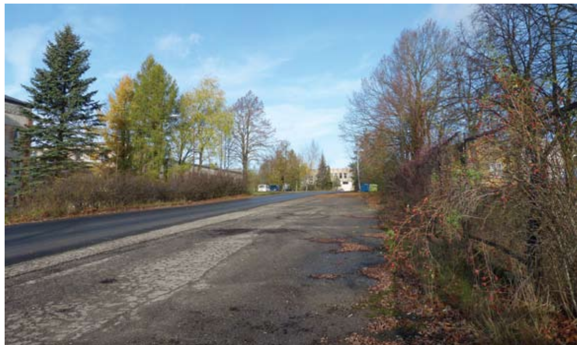
Šioje teritorijoje, Vairuotojų gatvėje, prie UAB „Anykščių šiluma“ kontoros, planuojama įrengti mobilųjį koronaviruso patikros punktą

O Anykščių rajono vadovai gavo šalies valdžios nurodymą mūsų mieste įsteigti mobilųjį koronaviruso patikros punktą.