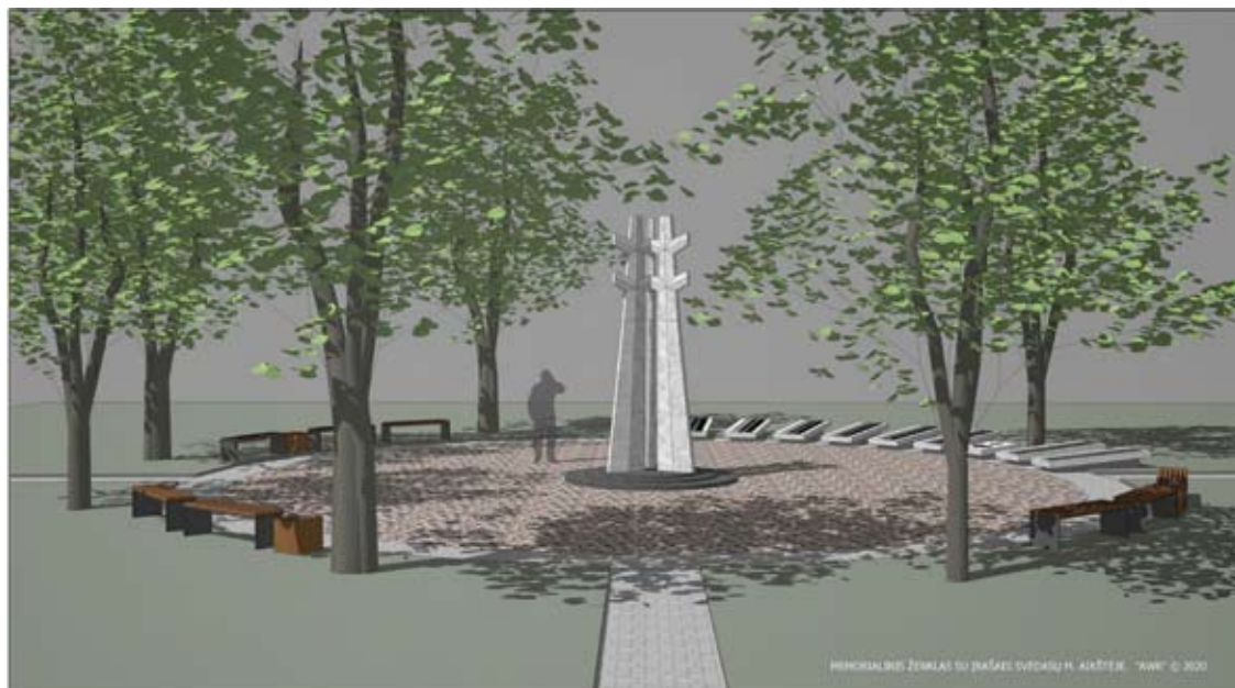
Planuojamojo paminklo Bronės Buivydaitės aikštėje sprendiniai.

Vidmantas ŠMIGELSKAS vidmantas.s@anyksta.lt