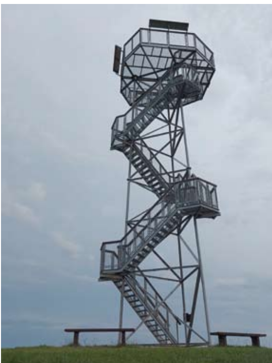
Gaiva Di. Bijeikių apžvalgos bokštas.