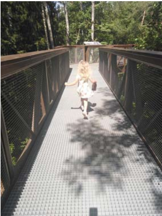
Aušra Strazevičiūtė. Lajų take labai smagu su dukrele.