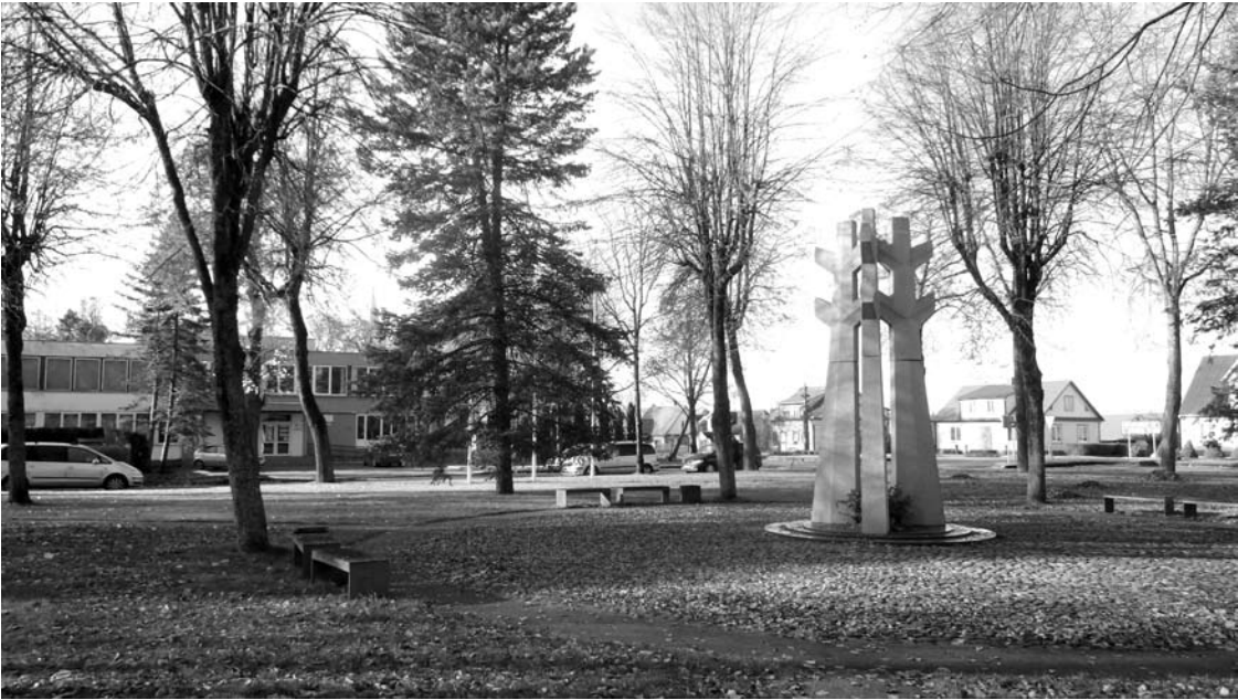
2009 metais B. Buivydaitei aikštės centre pastatytas paminklas – akmeninė skulptūrinė kompozicija už Lietuvos laisvę žuvusiems Svėdasų krašto kovotojams (aut. skulptorius Jonas Jagėla).